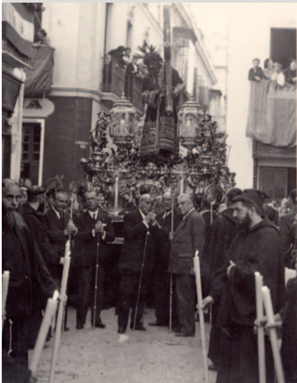
Procesión de ida a la Catedral en agradecimiento al final de la Guerra Civil Española. Mayo de 1939.