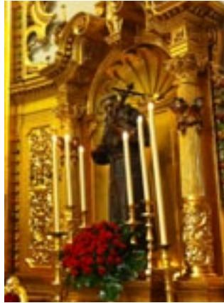
Fray Diego José de Cádiz recibió su culto ubicado en la hornacina de San Juan.