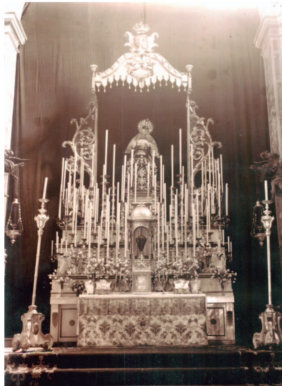
Altar de Septenario a María Santísima del Mayor Dolor y Traspaso en la parroquia de San Lorenzo. 1940 ca.

(*) Este artículo hizo merecedor a su autor del Premio Fernando Carrasco que otorga el Consejo de Cofradías.